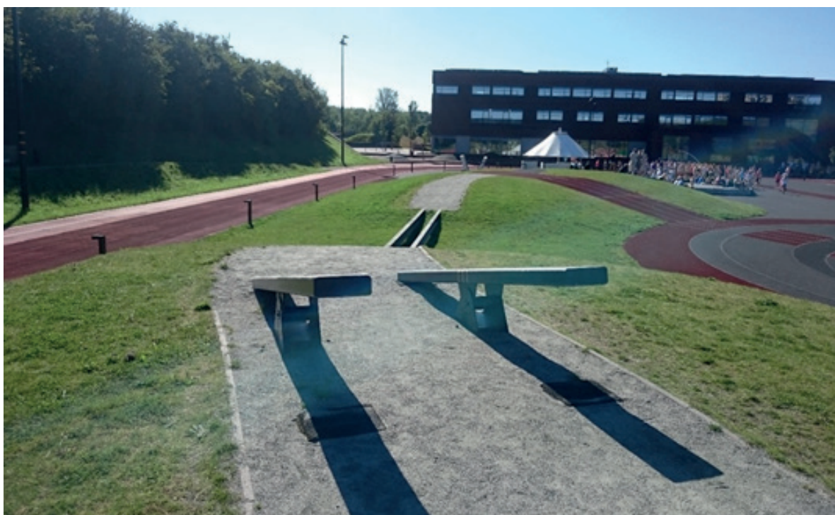
Parc Athletics Exploratorium, Odense, Danemark 2 : mille et une façons d'explorer l'athlétisme